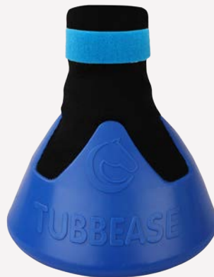
Blau - 160mm (6 1/4 inches)