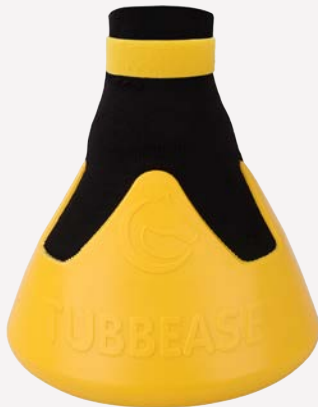
Gelb - 175mm (7 inches)

Bitte beachten Sie, dass die folgenden Abmessungen den maximalen Innendurchmesser des Tubbease angeben, nicht den Durchmesser des Hufes. Tubbease kann auch über Hufeisen angebracht werden.