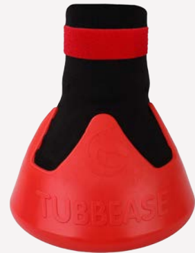
Rot - 145mm (5 1/2 inches)