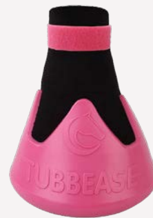
Pink - 110mm (4 1/2 inches)