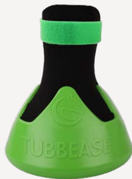
Grün - 130mm (5 1/8 inches)